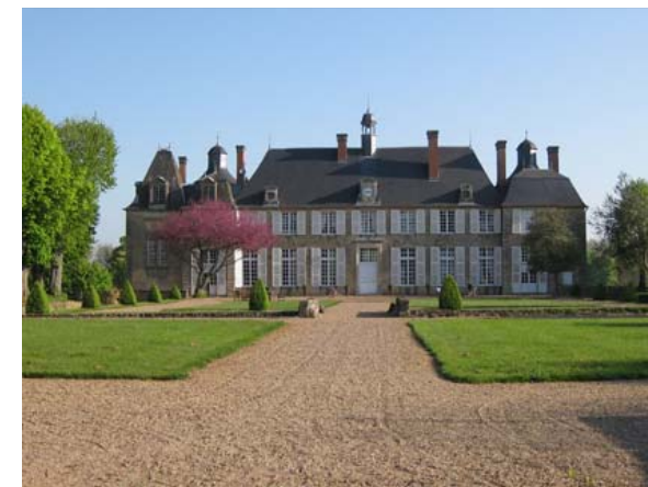
Le Château d'Apremont (à Arthel)

organisée par Le Lions Club Nevers Doyen avec le concours des Toques nivernaises des Vignerons Nivernais . et de Groupama